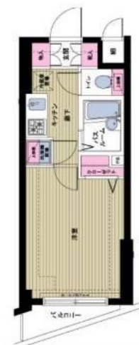
間取り・レイアウトイメージ