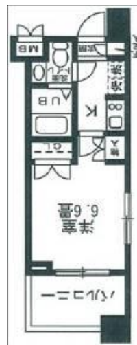
間取り・レイアウトイメージ