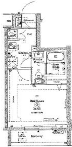
間取り・レイアウトイメージ