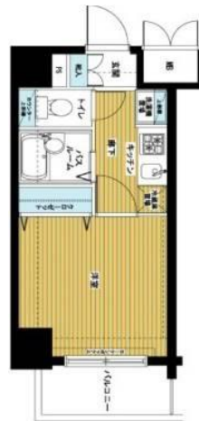
間取り・レイアウトイメージ