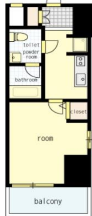
間取り・レイアウトイメージ