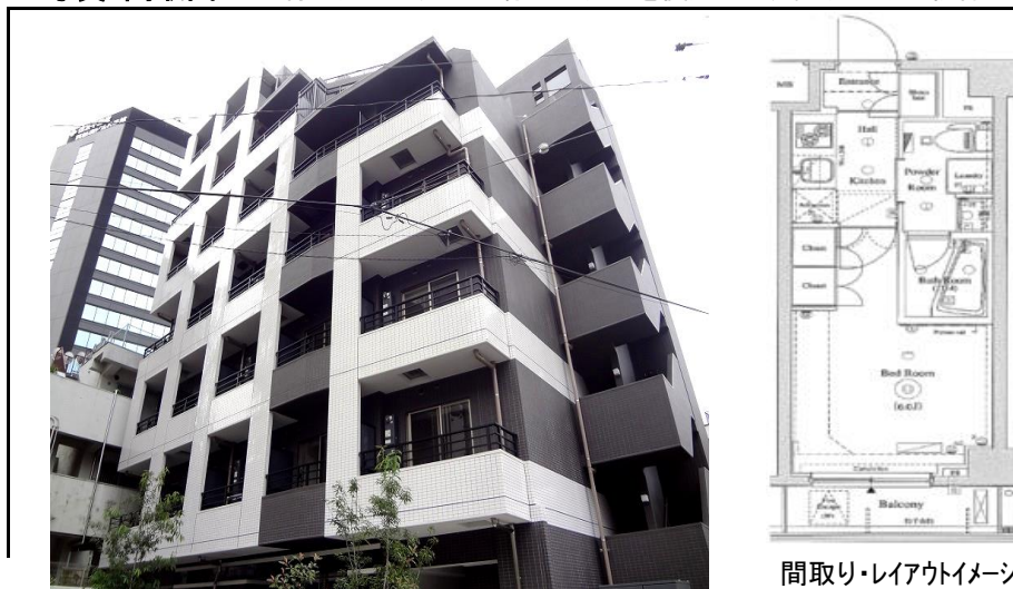
間取り・レイアウトイメージ