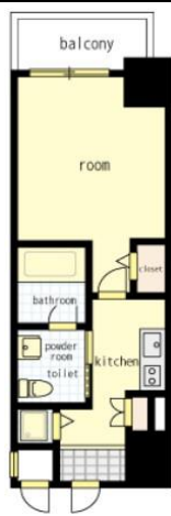
間取り・レイアウトイメージ