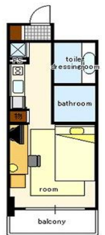
間取り・レイアウトイメージ