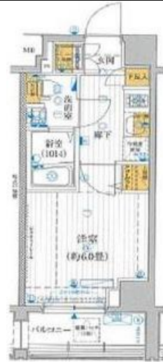
間取り・レイアウトイメージ