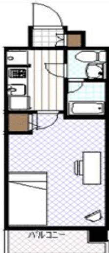
間取り・レイアウトイメージ