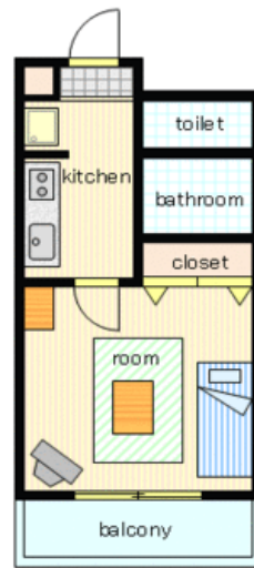
間取り・レイアウトイメージ