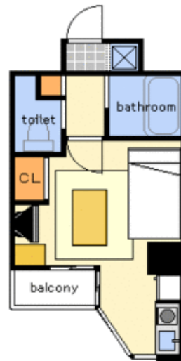
間取り・レイアウトイメージ