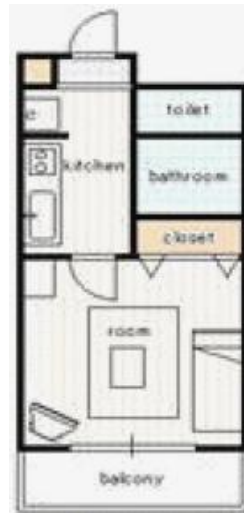
間取り・レイアウトイメージ