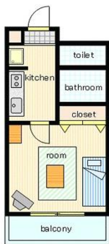
間取り・レイアウトイメージ