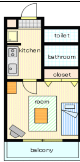
間取り・レイアウトイメージ