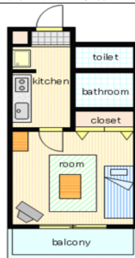
間取り・レイアウトイメージ